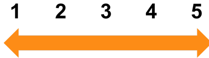
Imagen: Escala de calificación de 1 a 5 con una flecha naranja horizontal que indica un espectro

5 - El criterio se menciona con especificidad e intención sólidas, alineación clara con los demás criterios.